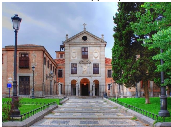
Монастырь Энкарнасьон в Мадриде

Кровь, которая пребывает в твердом состоянии в течение всего года, становится жидкой, без всякого вмешательства человека. Это чудо в Мадриде происходит накануне дня памяти мученической кончины святого - 9 августа (по нов.ст.).