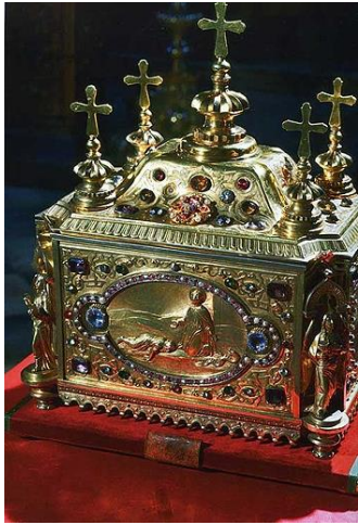
Ковчег с цельбонос- ной главой вмч. Пантелеимона

больным, убогим и нищим. Он безмездно лечил всех обращавшихся к нему, посещал в темницах узников и при этом исцелял страждущих не столько медицинскими средствами, сколько призыванием Господа Иисуса Христа. Это вызвало зависть, и врачи донесли императору, что святой Пантолеон