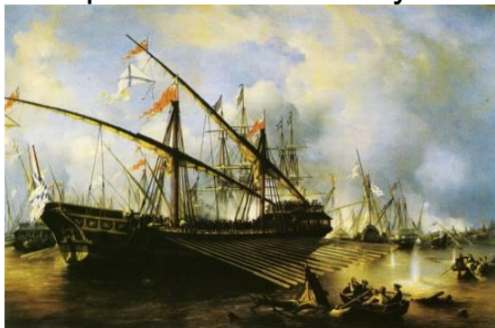
Сражение между шведским и русским флотами в Балтийском море около острова Гренгам - последнее крупное сражение Северной войны. Конец безраздельного шведского влияния на Балтийском море.

Память святого Пантелеимона издревле чтится Православным Востоком. Почитание святого мученика в Русской Православной Церкви известно с XII века. Великий князь Изяслав, в святом Крещении Пантелеимон, имел изображение великомученика на своем боевом шлеме и его заступничеством